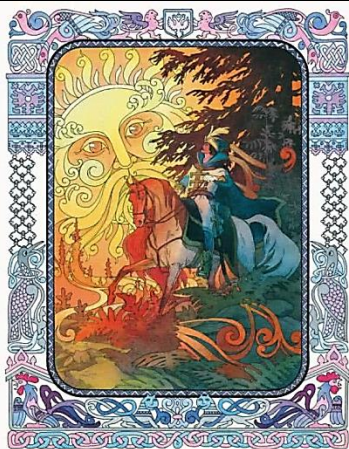
«Достань до месяца»